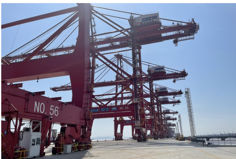
图为宁波舟山港一隅。

他们又在试验室内通过提升强度等级、优选水泥品种,优化骨料级配,延长混凝土搅拌时间、提升蒸养温度……最终将抗压强度从60兆帕提高到70兆帕,混凝土